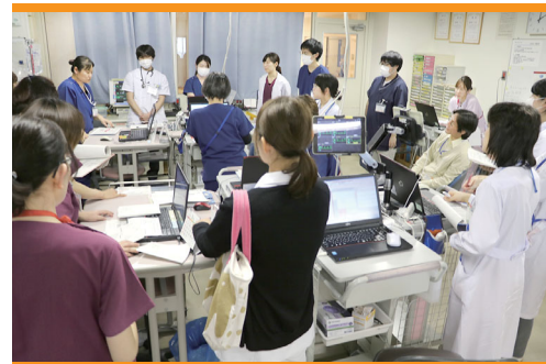
病棟でのカンファレンス

緩和ケアとは、このような患者さんに生じるさまざまな苦痛をやわらげることを目的として行われる医療のことです。緩和ケアは、末期がんの患者さんだけが受けるものではありません。近年はがん以外の疾患の患者さんに生じている苦痛に対しても、緩和ケアが必要とされています。