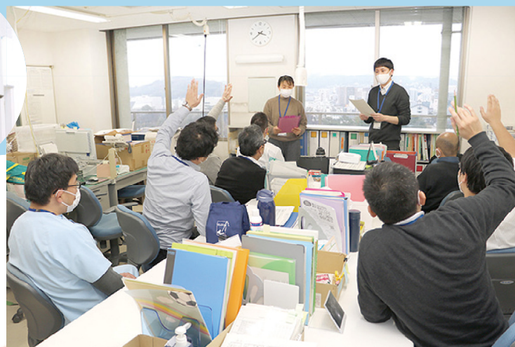
今日の仕事を振り返り明日に活かす