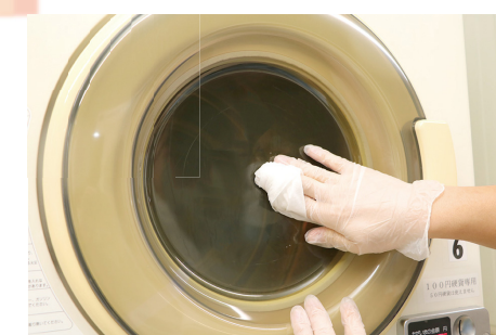
ランドリーの清掃